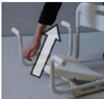
Smochin. Nu. 2 / Fig. Nu. 2 / Pic. De la 2 / Smochin. Nu. 2