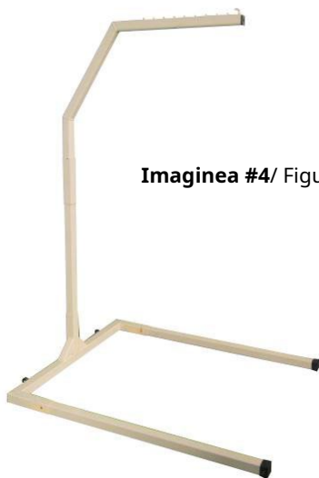
Imaginea #4/ Figura #4

3. Instalați suportul ca în Figura #4. Instalați brațul ca în Figura #4.