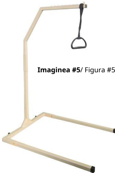
Imaginea #5/ Figura #5

4. Instalați mânerul din plastic. Puneți mânerul de plastic ca în Figura #5.