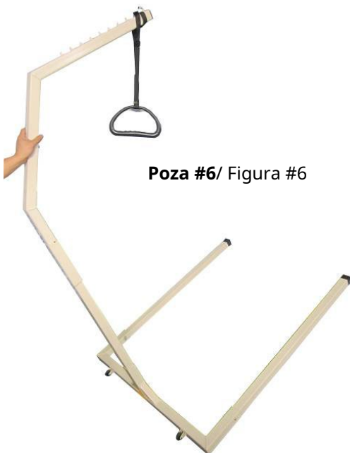
Poza #6/ Figura #6