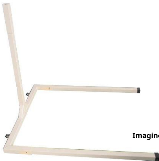
Imaginea #3/ Figura #3

2. Instalați tubul de sprijin ca în Figura #3. Instalați bara de sprijin ca în Figura #3.